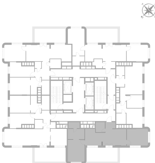
Расположение на этаже — корпус К1, 15 этаж из 17