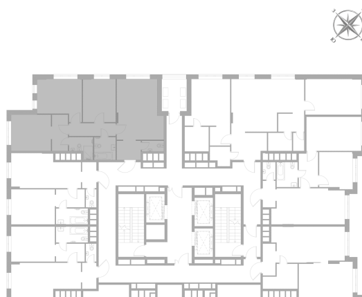
Расположение на этаже — корпус К1, 2 этаж из 17