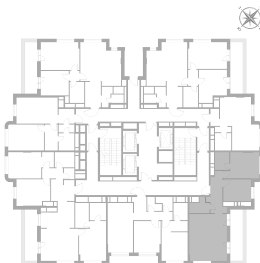
Расположение на этаже — корпус K2, 18 этаж из 22