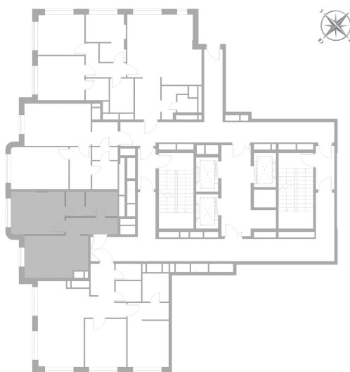
Расположение на этаже — корпус K2, 2 этаж из 22