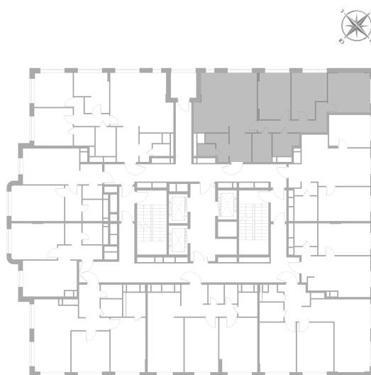
Расположение на этаже — корпус K2, 5 этаж из 22