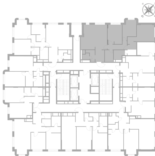
Расположение на этаже — корпус K2, 6 этаж из 22