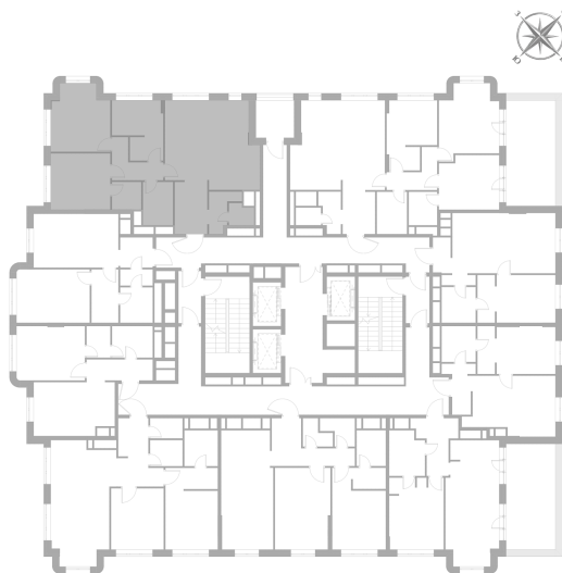
Расположение на этаже — корпус K2, 9 этаж из 22