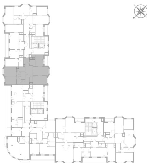
Расположение на этаже — корпус К3, 5 этаж из 9