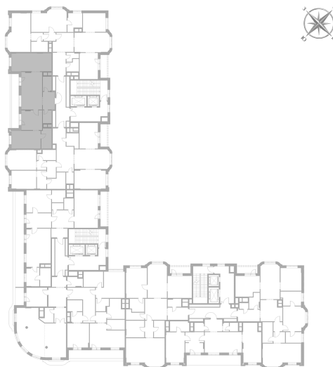
Расположение на этаже — корпус К3, 6 этаж из 9